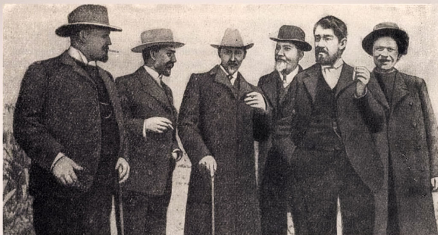
Реалистическое направление в русской литературе на рубеже XX в. продолжали Л.Н. Толстой, А.П. Чехов, И.А. Бунин и А.И. Куприн.